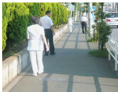
禁煙見廻隊パトロール実施中！

神奈川県では、平成22年4月1日から「公共的施設における受動喫煙防止条例」が施行されております。